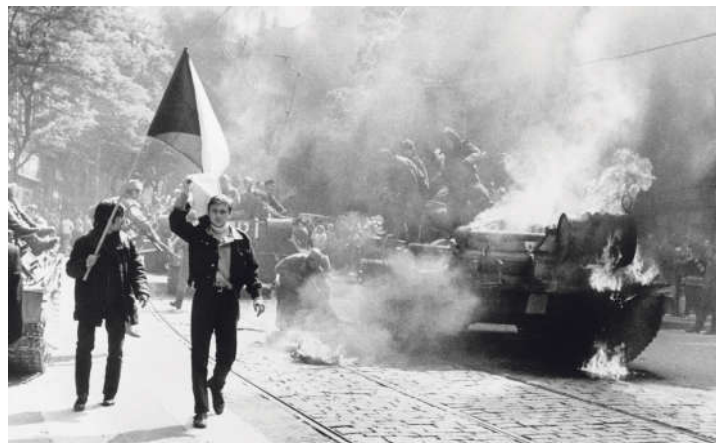
Eines der berühmtesten Bilder von der Niederschlagung des Prager Frühlings: Prager Demonstranten gehen mit der tschechoslowakischen Flagge an einem brennenden sowjetischen Panzer vorbei.

Wie haben Sie den nächsten Tag verbracht?