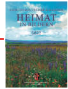
Der Sudetendeutsche Kalender 2022.